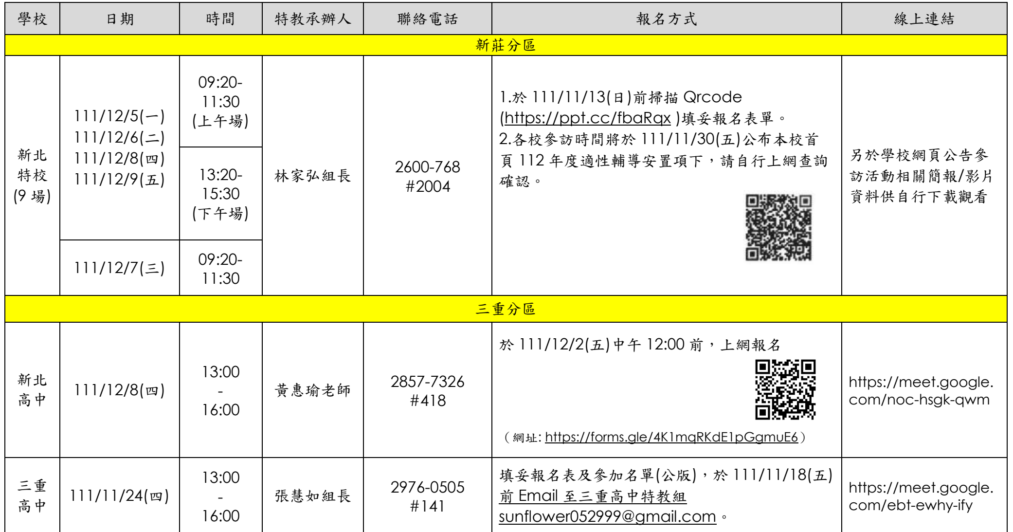
新北市 111 學年度國中身心障礙學生參訪高中職活動時間一覽表