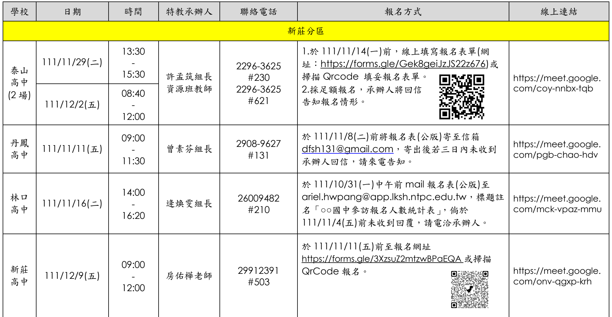
新北市 111 學年度國中身心障礙學生參訪高中職活動時間一覽表