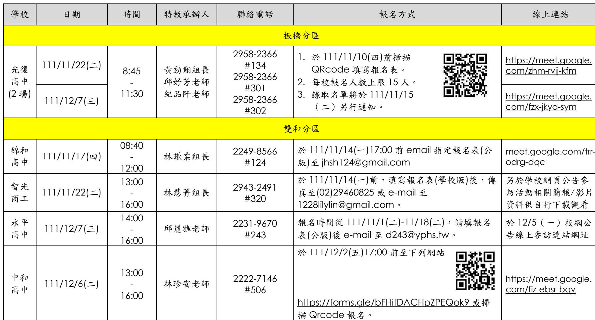
新北市 111 學年度國中身心障礙學生參訪高中職活動時間一覽表

備註：參訪活動回饋表( https://forms.gle/3vwYxs5syZVtWEEaA )，請參加參訪活動者於參訪各校結束後一週內填寫回傳。