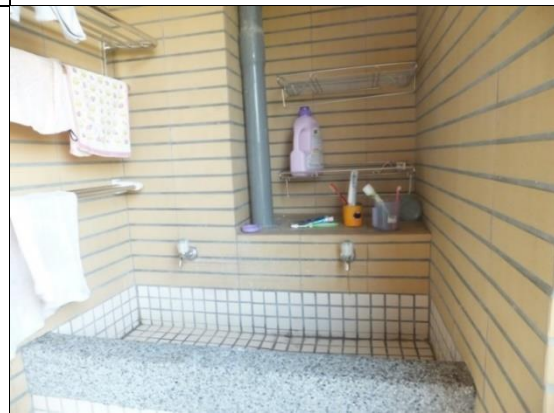
寢室設有洗衣台及曬衣空間