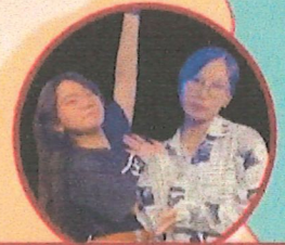
青出魚藍 魚丸、小藍