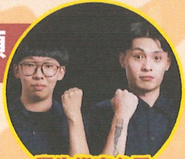
學生指定必看 漫才團體