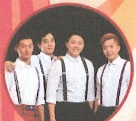
搏逗兄弟 黑輪、王曜、火柴、小岳