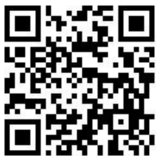
桃園市國民中學藝術才能美術班 鑑定線上報名系統