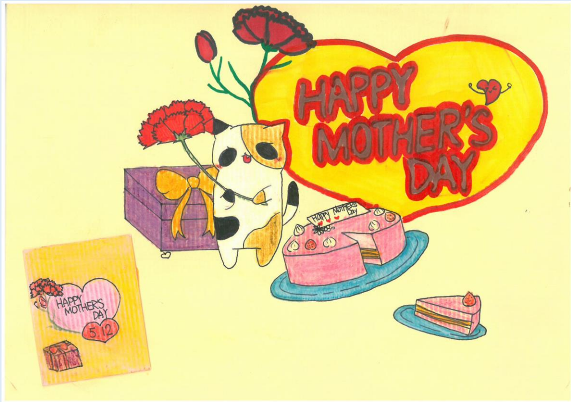
二年級母親節卡片 佳作 202 莊雅竹