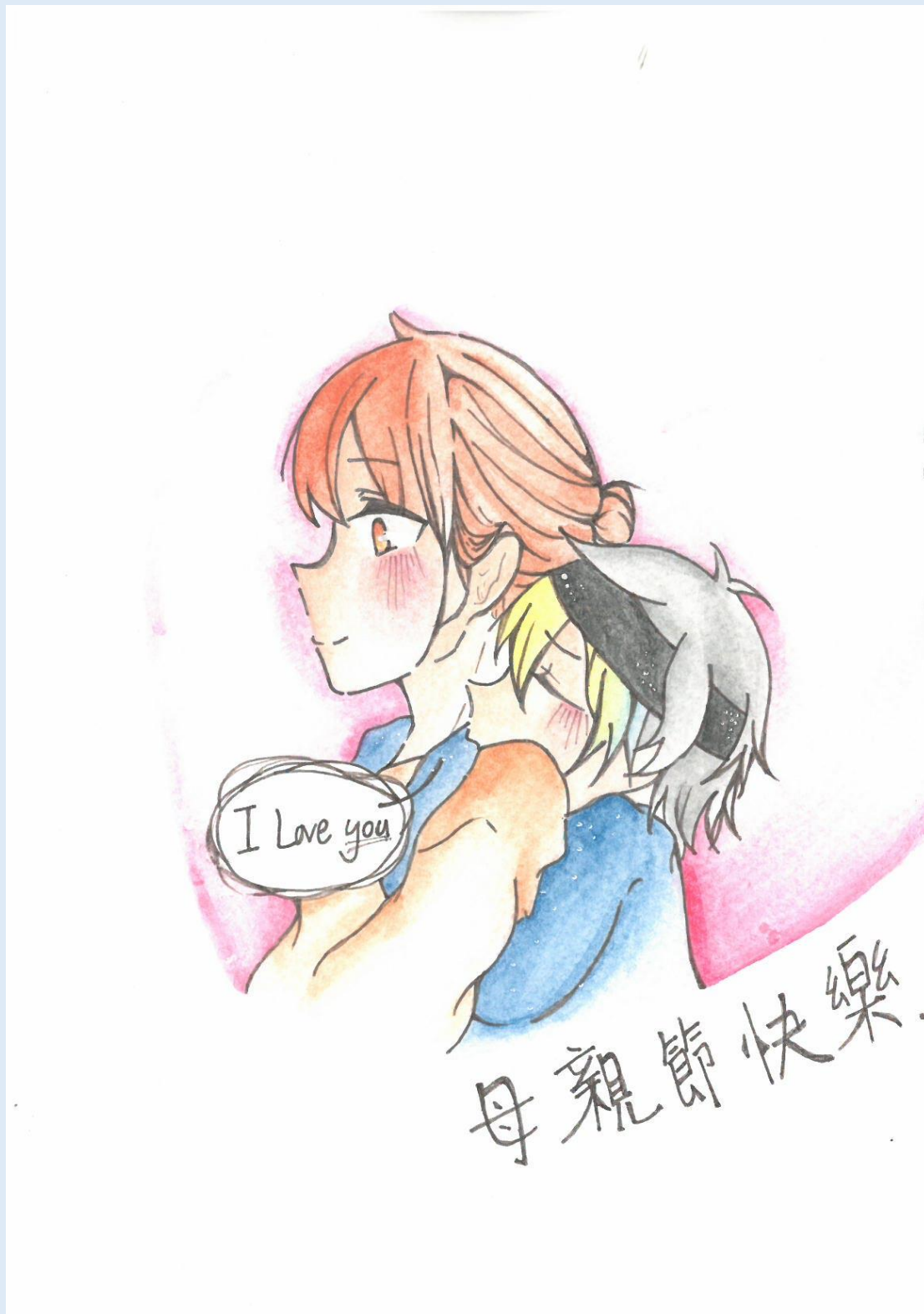
二年級母親節卡片 第三名 211 邱沛宸