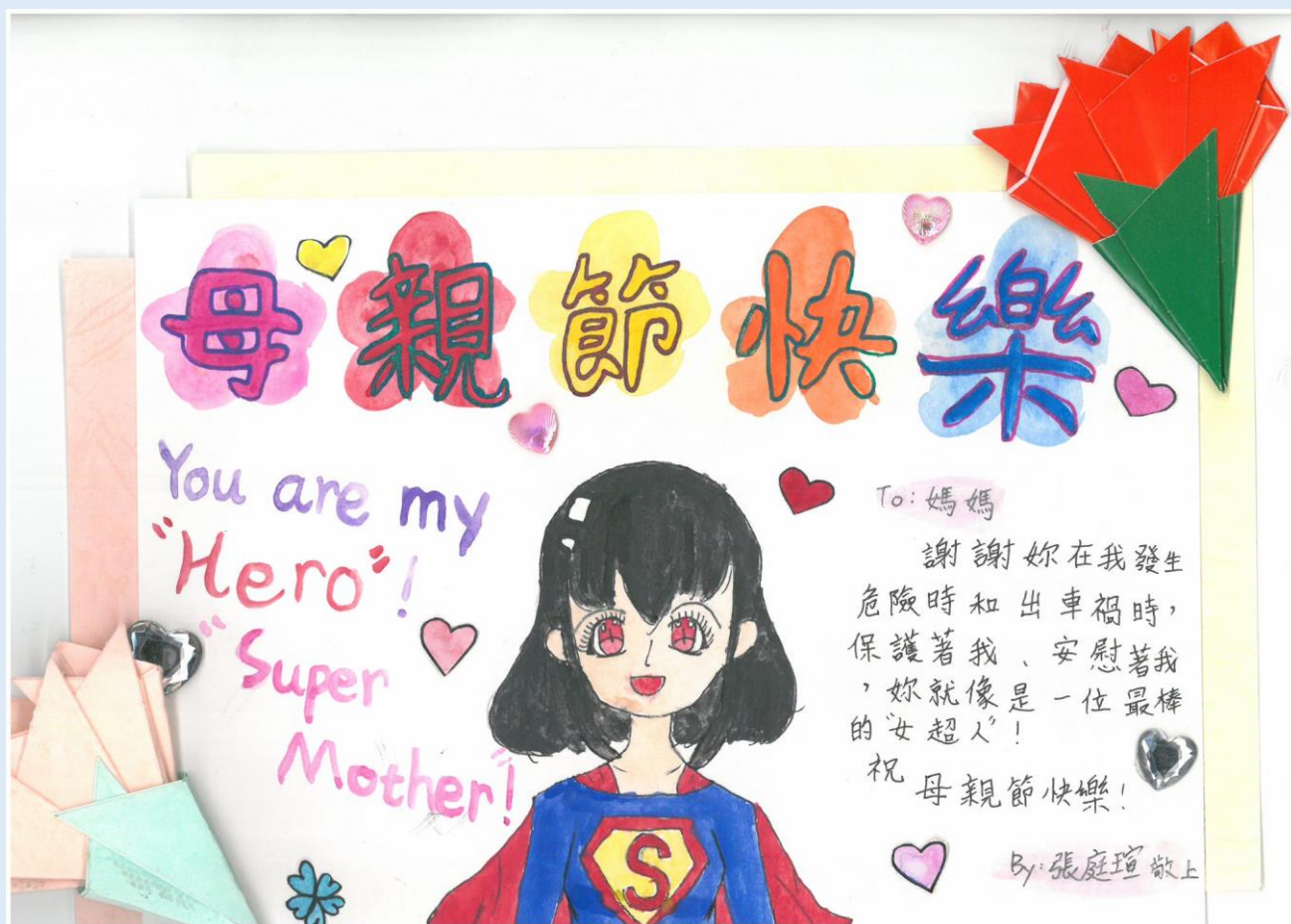
二年級母親節卡片 第三名 205 張庭瑄