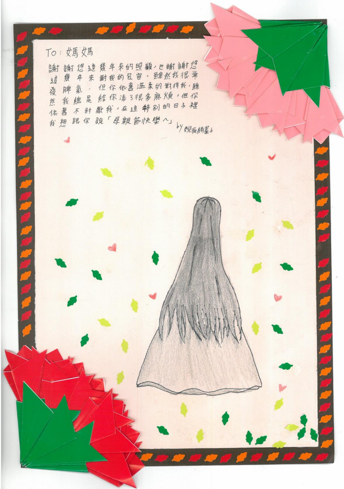
二年級母親節卡片 佳作 216 吳綺蓁

謝謝您這幾年來的照顧，也謝謝您這幾年來對我的包容，雖然我很常發脾氣，但你依舊溫柔的對待我，雖然我總是給你添了很多麻煩，但你依舊不討厭我，在這特別的日子裡我想跟你說「母親節快樂」 by 妮吳綺蓁