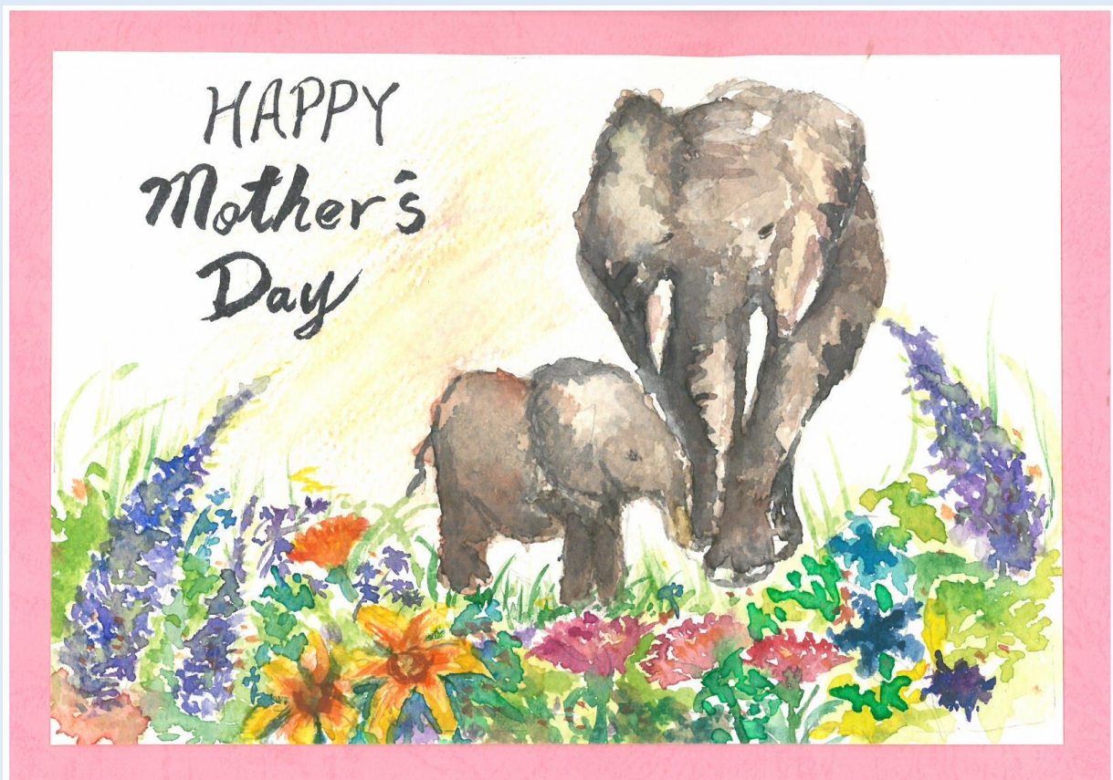
二年級母親節卡片 第二名 219 劉珈彤