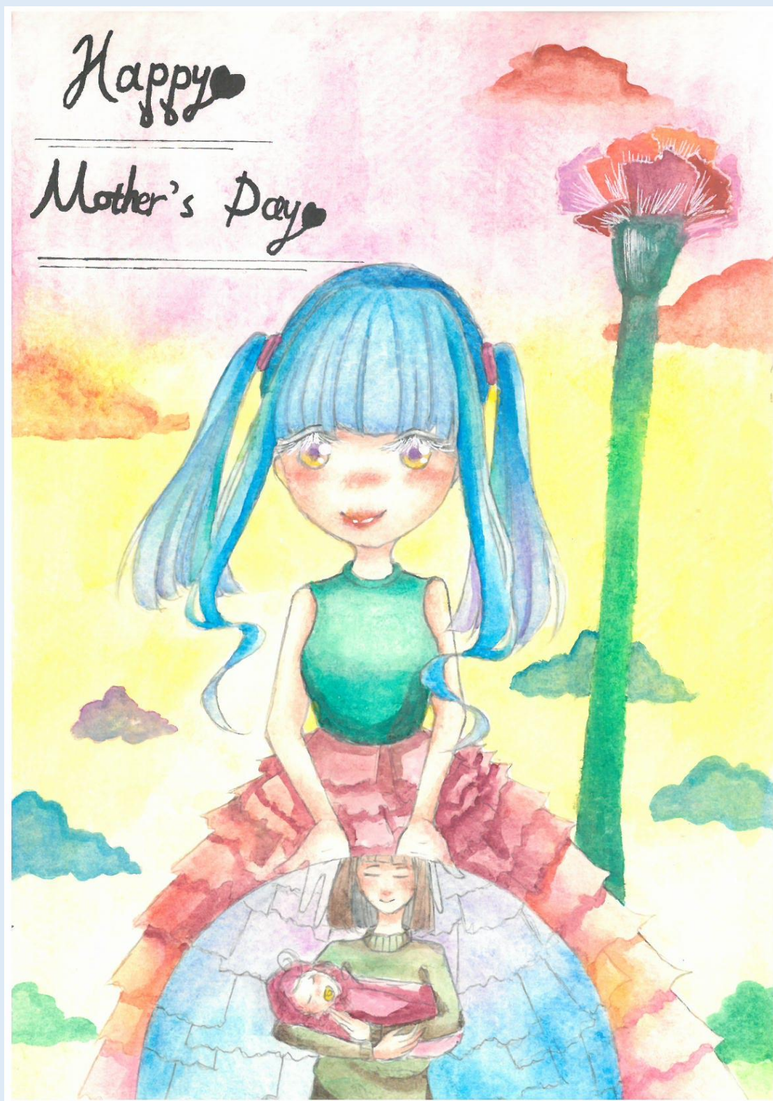
二年級母親節卡片 第一名 211 鄧瑄琳