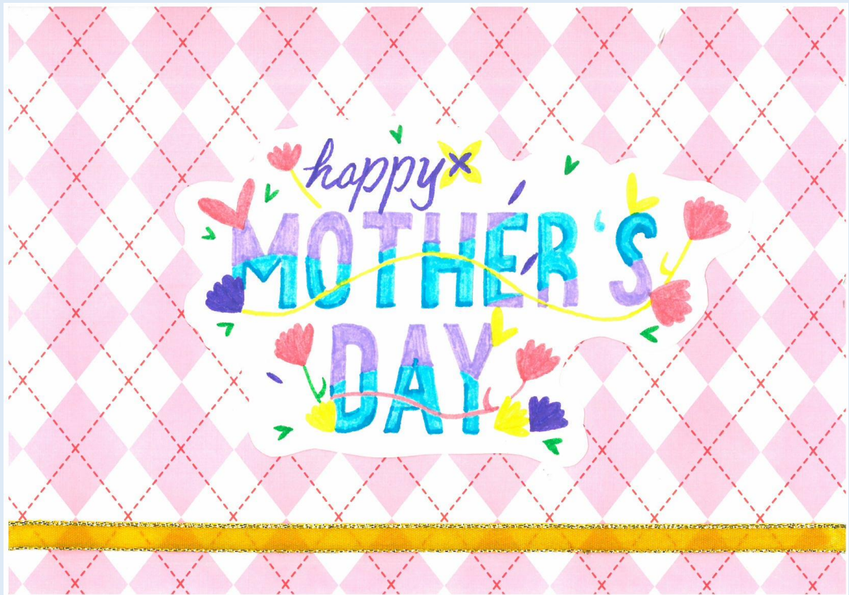
二年級母親節卡片 第二名 210 王歆渝