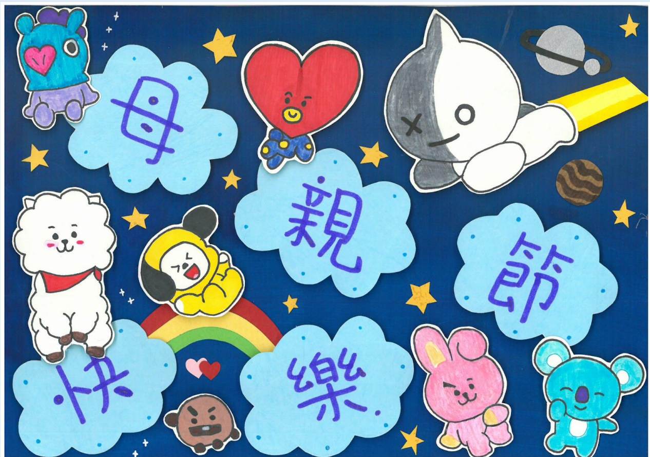
二年級母親節卡片 佳作 209 張芸禎